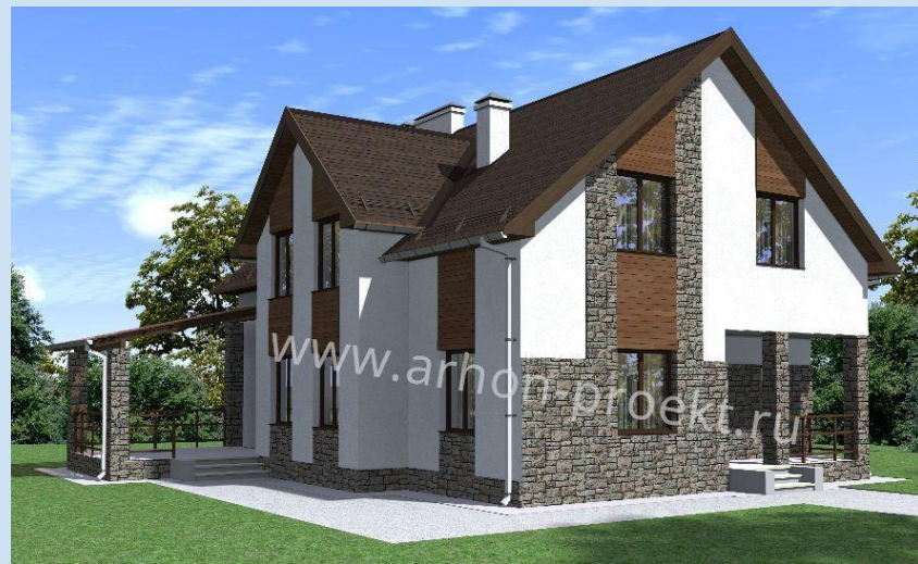
Визуализация дома и гаража